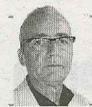
Juan José Millás

■ Lo que dice Carlos Floriano de Ana Mato y la impotencia de quienes se revuelven mientras le escuchan en el sofá del telediario